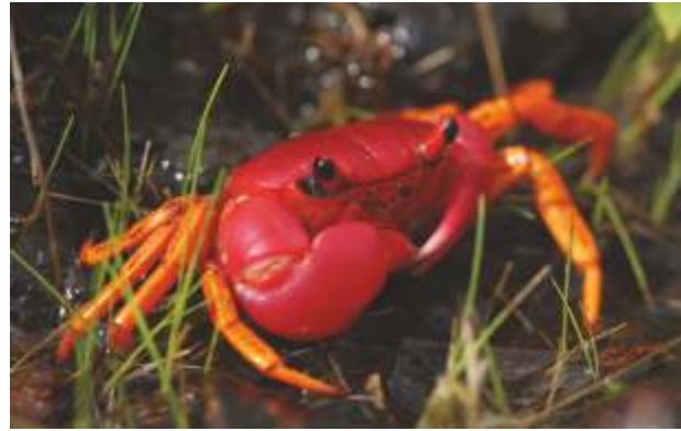
पिंक फॉरेस्ट क्रॅब