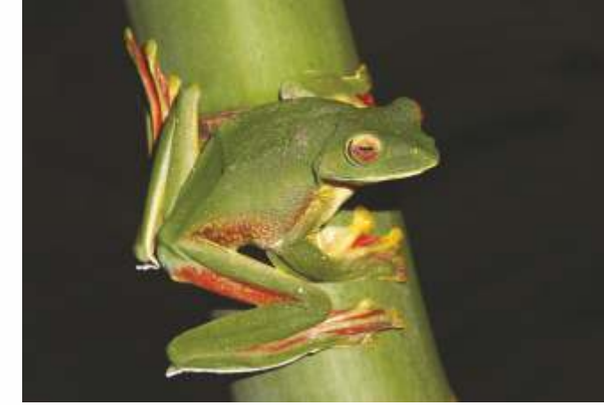
मलबार ग्लायडींग फ्रॉग

समुद्रसपाटीपासून ६९० मीटर (२,२६० फूट) उंचीवर असलेले आंबोली हे महाराष्ट्रातील एक थंड हवेचे ठिकाण म्हणून प्रसिद्ध आहे. जैवविविधतेने संपन्न असे हे ठिकाण प्रामुख्याने वैविध्यपूर्ण सरिसृप व उभयचरांसाठी प्रसिद्ध आहे. पट्टेरी वाघाचे अस्तित्वही या ठिकाणी सातत्याने आढळून येत आहे. आंबोली आणि दोडामार्ग परिसरात गेल्या काही वर्षात करण्यात आलेल्या अभ्यासातून सरिसृपाच्या अनेक नवीन प्रजातींचा शोध लागलेला आहे. जैवविविधतेच्या दृष्टीने हा परिसर अतिशय संवेदनशील आहे.