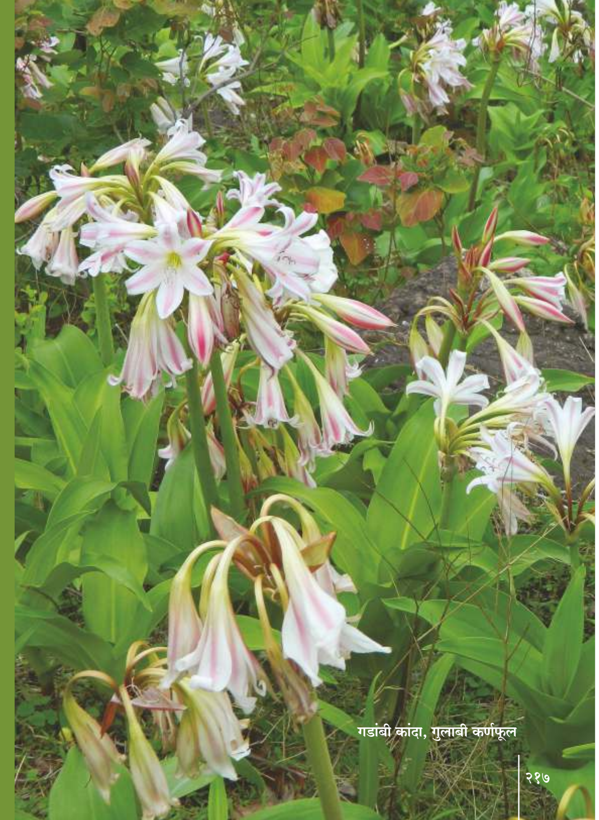
गडांबी कांदा, गुलाबी कर्णफूल