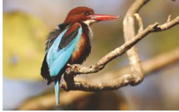
पांढऱ्या छातीचा धीवर